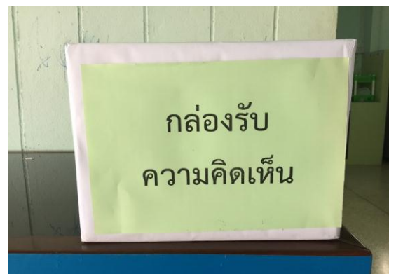
กล่องรับความคิดเห็น