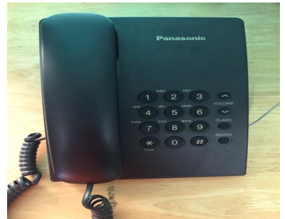
ร้องเรียนผ่านโทรศัพท์สำนักงาน เบอร์ ๐ ๗๗๓๙ ๙๐๑๔